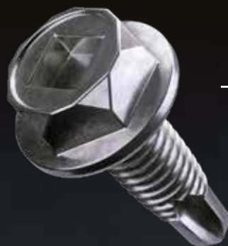
— aangepaste ring