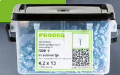
Inclusief magneetdop 7mm en bit

Zelfborende parker, fijndraad, frees onder de kop, dit voorkomt meedraaien. Toepasbaar met magneet dop 7 mm of eventueel met vierkante bit. Inclusief aangepaste ring.