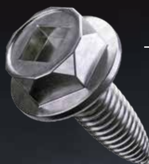
— aangepaste ring